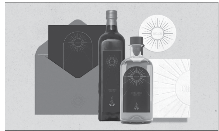
Imazh i ri tregtar

Një imazh i ri tregtar është gati tashmë për kompaninë e tyre.