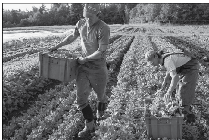
Referuar marrëveshjes, totali i kredive të dhëna nga bankat për një huamarrës nuk duhet të kalojë vlerën prej 250 mijë euro dhe afati i kredisë nuk mund të jetë më i ulët se tre vjet dhe më i lartë se 5 vjet. Që të kualifikohen për kredi,

garantimin e interesave, kamatëvonesave dhe penaltiteteve apo çdo lloj detyrimi tjetër monetar që buron nga huatë.