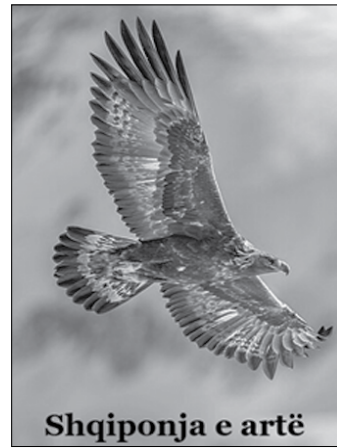
Shqiponja e artë

Shqiponja tullace (Haliaeetus leucocephalus) është një shpend grabitqar që gjendet në Amerikën e Veriut. Është shqiponjë deti. Shqiponjat tullace nuk janë tullace; emri rrjedh nga një kuptim më i vjetër i fjalës, "me kokë