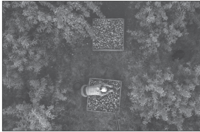
një vullnet të tre këtyre aktorëve që të vijë se nuk vjen.

“Jemi aktualisht në një pozicion që nuk kemi një skemë sigurimi që të që të kënaqë interesat e fermerëve, nuk e kemi sepse nuk ekziston një vullnet për të bashkëpunuar të katër aktorë, qeveria, donatorët, fermerët dhe kompanitë e sigurimeve. Këta aktorë duhet të bashkëpunojnë, të ndërveprojnë me njëri tjetrin, në mënyrë të tillë që ti ofrojnë këtij sektori që është i vështirë, një skemë që të jetë e pranueshme dhe e përballueshme nga të katër aktorët. Deri tani të gjithë barrën e peshës dhe të sakrificës ia kemi lënë fermerit. Nëse ndodh breshër i dëmtohet prodhimi dhe e mban ai gjithë peshën, shoqëritë e sigurimit