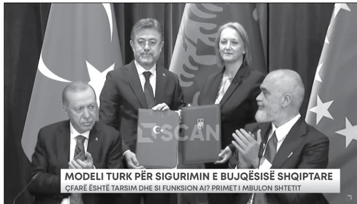
MODELI TURK PËR SIGURIMIN E BUJQËSISË SHQIPTARE ÇFARË ËSHTË TARSIM DHE SI FUNKSIONON AI? PRIMET I MBULON SHTETI

për blegtorinë ose peshkimin. TARSIM mbulon një gamë të gjerë rreziqesh natyrore si: