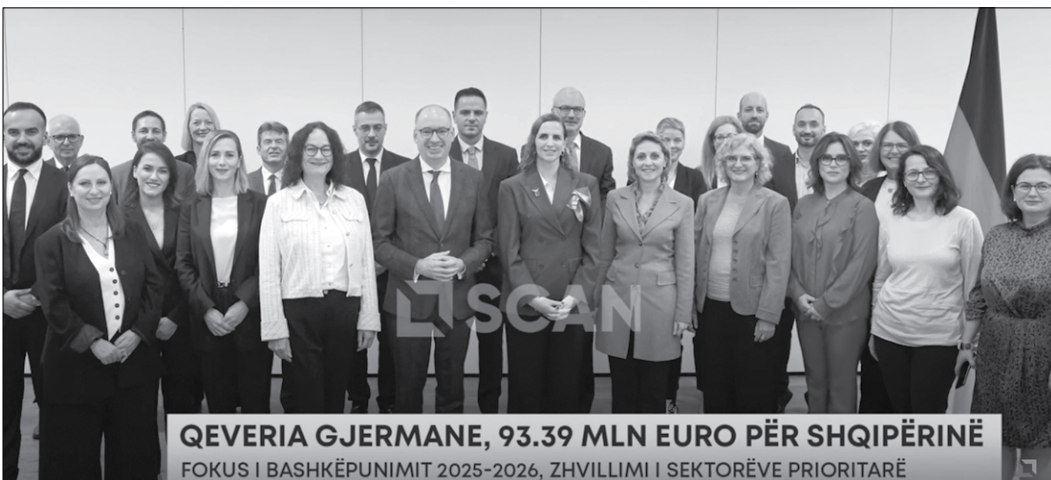
QEVERIA GJERMANE, 93.39 MLN EURO PËR SHQIPËRINË FOKUS I BASHKËPUNIMIT 2025-2026, ZHVILLIMI I SEKTORËVE PRIORITARË

Me këtë duam të japim një mesazh të qartë: Ne vlerësojmë përparimet në reforma të vendit dhe i qëndrojmë në krahasim partnerëve tanë me vlerë në procesin e anëtarësimit në BE!