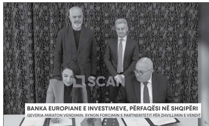
BANKA EUROPIANE E INVESTIMEVE, PËRFAQËSI NË SHQIPËRI QEVERIA MIRATON VENDIMIN. SYNON FORCIMIN E PARTNERITETIT PËR ZHVILLIMIN E VENDIT

Banka Evropiane e Investimeve ofron mbështetjen e saj në sektorë të rëndësishëm të ekonomive të vendeve të Ballkanit Perëndimor që aspirojnë të anëtarësohen në Bashkimin Evropian, siç është dhe Republika e Shqipërisë një kandidatë drejt anëtarësimit dhe integritetit në BE.