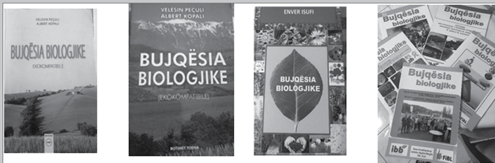
Botime për bujqësinë biologjike nga Universiteti Bujqësor dhe Instituti i Bujqësisë Biologjike, Durrës, (vitet 2005, 2013, 2024)

Siç shikohet këto 10 vitet e fundit në botime, logo kombëtare dhe certifikatat për ferma, është përdorur termi "Bujqësia Biologjike" dhe "Produkt "BIO"