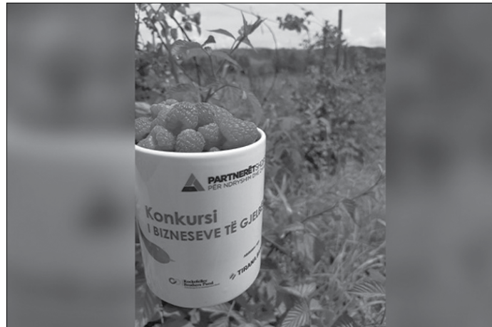
Bank, Sentiljana pati mundësi të investonte në përmirësimin e proceseve të fermës së saj, duke blerë pajisje moderne që

Falë mbështetjes financiare dhe teknike të ofruar nga Tirana