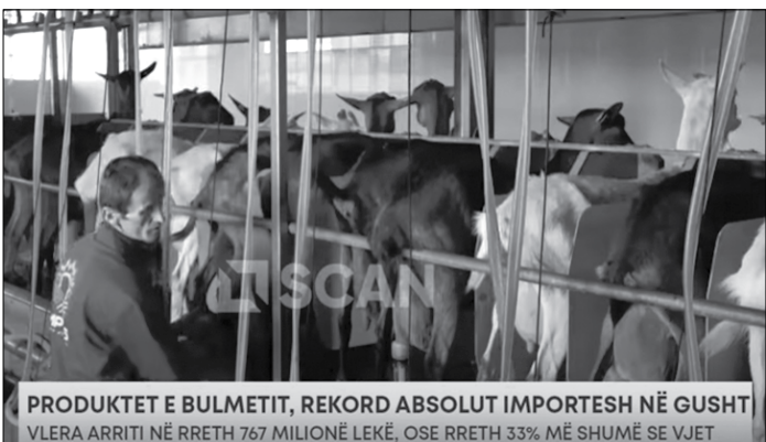
PRODUKTET E BULMETIT, REKORD ABSOLUT IMPORTESH NË GUSHT VLERA ARRITI NË RRETH 767 MILIONË LEKË, OSE RRETH 33% MË SHUMË SE VJET

Italia, Gjermania, Hungaria, Greqia dhe Serbia janë partnerët kryesorë tregtarë të Shqipërisë në drejtim të importit të produkteve të bulmetit.