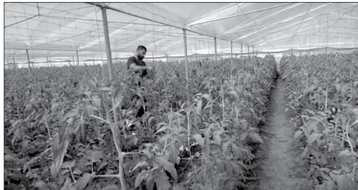
Çifti që prodhon mbi 50 ton perime në një sezon kërkon do të braktisin fshatin dhe do të rikthehen në emigrim.

por kaq nuk mjaftonte për të përballuar kostot e prodhimit.