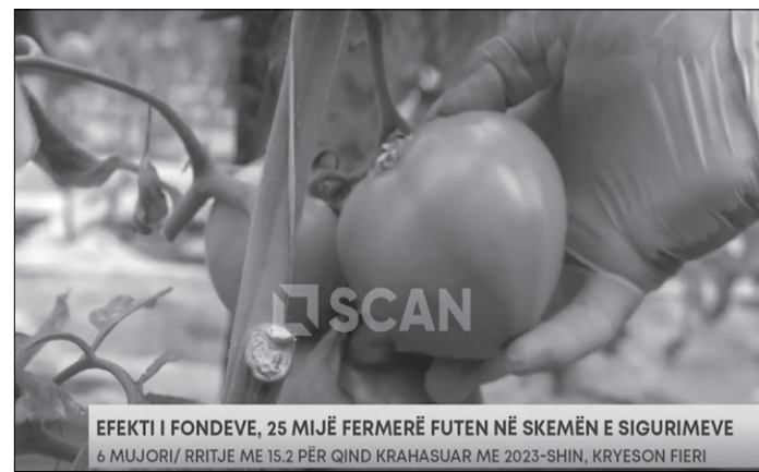
EFEKTI I FONDEVE, 25 MIJË FERMERË FUTEN NË SKEMËN E SIGURIMEVE 6 MUJORI/ RITJE ME 15.2 PËR QIND KRAHASUAR ME 2023-SHIN, KRYESON FIERI

Derdhja e kontributeve u jep të vetëpunësuarve në bujqësi të drejtën e përfitimit të pensionit. Pensioni i pleqërisë për këto kategori është mesatarisht 9,656 lekë në muaj,