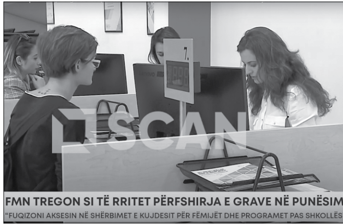
FMN TREGON SI TË RRIKET PËRFSHIRJA E GRAVE NË PUNËSIM "FUQIZONI AKSESIN NË SHËRBIMET E KUJDESIT PËR FËMIJËT DHE PROGRAMET PAS SHKOLLËS"

vetëm 1 për qind të grave që marrin pjesë në aktivitete aktive të programeve të tregut të punës.