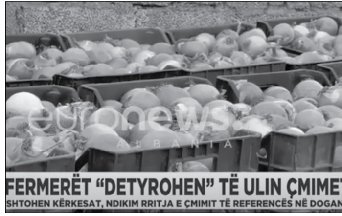
FERMERËT “DETYROHEN” TË ULIN ÇMIMET SHTOHEN KËRKESAT, NDIKIM RITJES E ÇMIMIT TË REFERENCËS NË DOGAN

Vetëm në bashkinë e Maliqit këtë vit janë prodhuar 16 mijë ton mollë, 25 mijë ton qepë dhe 23 mijë ton patate.