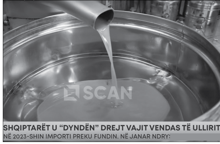
SHQIPTARËT U “DYNDËN” DREJT VAJIT VENDAS TË ULLIRIT NË 2023-SHIN IMPORTI PREKU FUNDIN. NË JANAR NDRY:

shërbimeve dhe akomodimit për shkak të bumit turistik, por edhe nga emigrantët që kanë përfituar për të bërë blerjet e nevojshme. Ndërsa një pjesë e mirë e sasisë së prodhuar u eksportua drejt Italisë, pas një marrëveshje të nënshkruar nga Ministria e Bujqësisë me au-