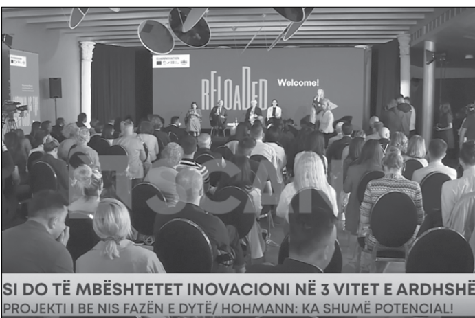
SI DO TË MBËSHTETET INOVACIONI NË 3 VITET E ARDHSHË PROJEKTI I BE NIS FAZËN E DYTË/ HOHMANN: KA SHUMË POTENCIAL!

mbështetëse të MBZHR, me qëllim zhvillimin e qëndrueshëm të saj dhe të ekonomisë rurale.