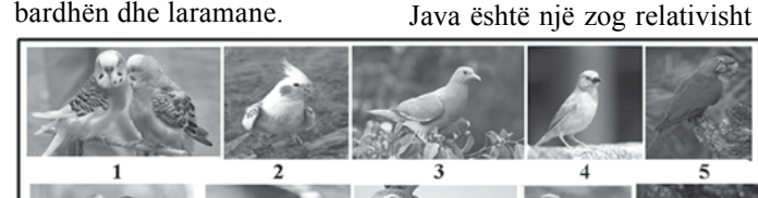
Disa nga llojet e zogjve shoqëruese më të njohur : 1.Papagaj Paraket 2.Papagaj Cockatiels 3.Pëllumbat 4.Kanarinat 5.Papagaj Hyacinth Macaws 6. Lovebirds. 7.Trishtilat 8.Papagalli African Grey 9.Papagajit Conure 10.Papagajit Macaw 11.Papagajit Kakados 12.Papagajit e Amazonës 13.Parrotlets 14.Harabeli 15.Thëllëzta

Pëllumbat zakonisht nuk kërkojnë shumë kohën ose vëmendjen e pronarëve të tyre. Kjo i bën pëllumbat llojin ideal të zogjve shoqëruese për pronarët me orare më të ngarkuara ose që nuk mund të jenë në shtëpi gjatë gjithë kohës. Këta zogj janë të qetë; kur i trajtoni ose i ushqeni me dorë, pëllumbat mund të jenë kafshë shtëpiake tepër të buta dhe të ëmbla. Me një trup të madh rreth 150-200 gram e gjatësi 25-35 cm, e jetëgjatësi 8-15 vjet. Pupla gri kafe, sy të zinj, sqep dhe jakë që rrethojnë qafën. Ngjyrat alternative përfshijnë portokallinë, të bardhën dhe laramane.