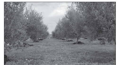
Pamje nga një ullishte me plehim organik para përmbysjes në tokë.

Si dhe sa herë bëhet plehërimi? Plehu hidhet jo më afër se 0.7-1m nga trungu ose ndërmjet rreshtave për të mos dëmtuar sistemin rrënjor. Pemët e reja zakonisht plehërohen në mënyrë të lokalizuar, vetëm në atë sipërfaqe toke ku ndodhet sistemi rrënjor. Gradualisht, me rritjen e pemëve rritet dhe sipërfaqja e plehëruar. Plehërimi organik rekomandohet të plehërohet së paku 1 herë në 2-3 vjet. Plehu organik përmbysset menjëherë në thellësinë 25-30 cm gjatë punimit Asimilimi i elementëve ushqyes që përmban plehu organik zakonisht zgjat 3 - 4 vjet.