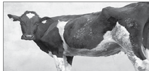
Foto lopë me Ketozë

kobalit gjithashtu shkakton ketozë. Kobalti është i nevojshëm për sintezën e mikroflorës bakteriale të rumenit, të vitaminës B12 dhe është esenciale për përdorimin adekuat të acidit propionik.