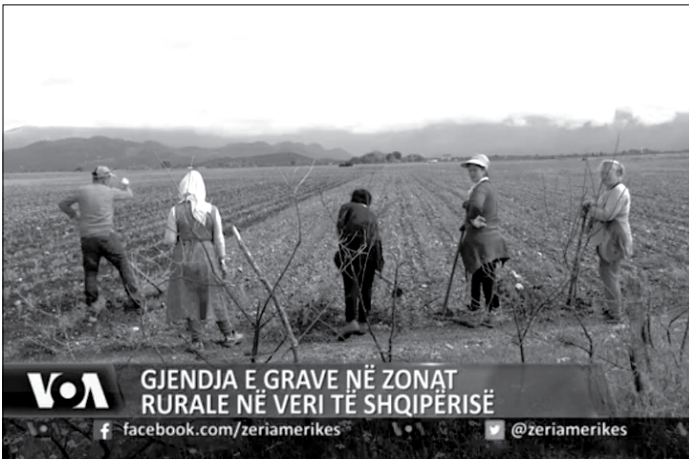
GJENDJA E GRAVE NË ZONAT RURALE NË VERI TË SHQIPËRISË

Problematikave që dalin nga territori, si mungesa e transportit, ujit të pijshëm, mungesa e qendrave shëndetësore 24 orëshe si dhe e çerdheve dhe kopështëve me drekë, megjithëse janë shqetësim i të gjithë komunitetit, së pari ato rëndojnë mbi jetën e grave dhe vajzave të zonave rurale.