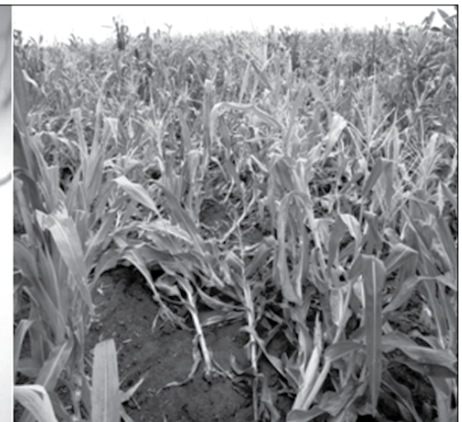
Rrëzimi i misrit kur dëmtohet nga Diabrotica