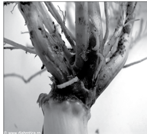
Rrënjë të dëmtuara nga Diabrotica