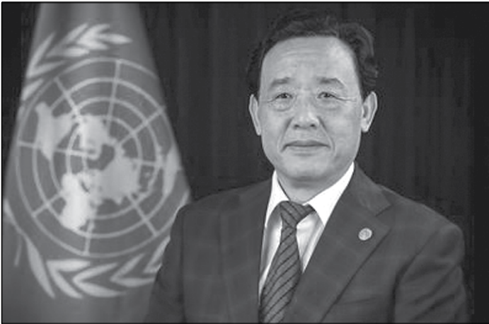
QU Dongyu , Drejtori i Përgjithshëm i Organizatës së Kombeve të Bashkuara për Ushqimin dhe Bujqësinë (FAO)

mirë sfidat e shkaktuara nga COVID-19. Ndërkohë, kemi qenë dëshmitarë se si pandemia ndikoi në prodhimin, tregtinë, logjistikën dhe konsumin e mallrave, përfshirë ushqimin dhe produktet e tjera bujqësore.